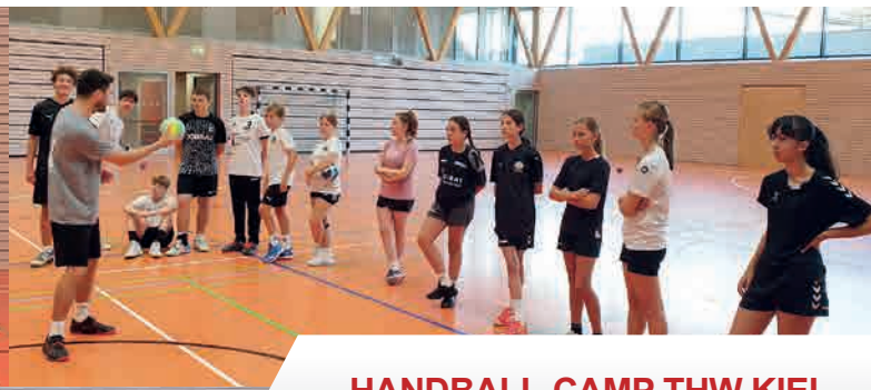
HANDBALL-CAMP THW KIEL Neue Sporthalle Brombach